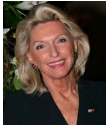
Die Familienunternehmerin des Jahres 2004: Maria-Elisabeth Schaeffler

Die Positivbilanz stammt nicht etwa aus der Mitarbeiterzeitschrift der neuen Mutter – sondern von der IG-Metall. Tatsächlich hat sich unter dem Dach der Herzogenauracher Familienholding ein Wälzlager-Multi mit 5,5 Milliarden Euro Umsatz formiert, Tendenz: steigend. Von Zerschlagung keine Rede. Kunden- und Produktportfolio beider Anbieter ergänzen sich hervorragend, bestätigen Branchenkenner. Und: Nicht FAG sei seinerzeit in schlechter Verfassung gewesen, sondern nur die Aktie. »Ein nicht stabiles Unternehmen hätten wir auch nicht gekauft«, sagt Maria-Elisabeth Schaeffler, die den Aktionären das 1,69fache des Börsenkurses gezahlt hat.